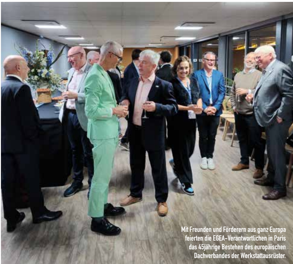
Mit Freunden und Förderern aus ganz Europa feierten die EGEA-Verantwortlichen in Paris das 45jährige Bestehen des europäischen Dachverbandes der Werkstattausrüster.

Auf die nächsten 45 Jahre voller Fortschritt, Partnerschaft und Innovation!